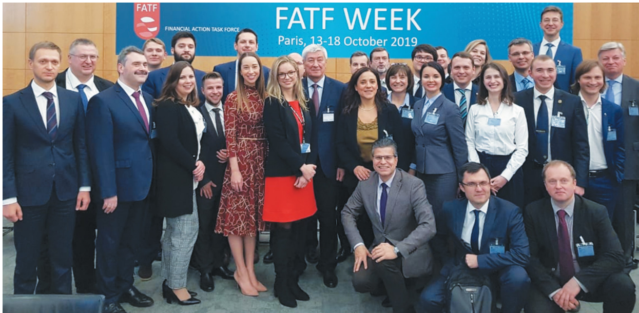
Команда Российской Федерации с оценщиками ФАТФ

Российская система противодействия отмыванию денег, финансированию терроризма и финансированию распространения оружия массового уничтожения (ПОД/ФТ/ФРОМУ) оценивалась в течение полутора лет (2018-2019 гг.) на предмет технического соответствия (имплементация в национальное законодательство положений международных стандартов ПОД/ФТ/ФРОМУ – Рекомендаций ФАТФ) и эффективности (практического применения таких положений) за пятилетний период (2014-2018 гг.).