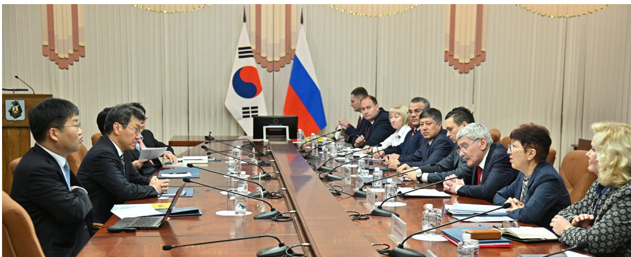
Встреча с финансовой разведкой Республики Корея в Хабаровске