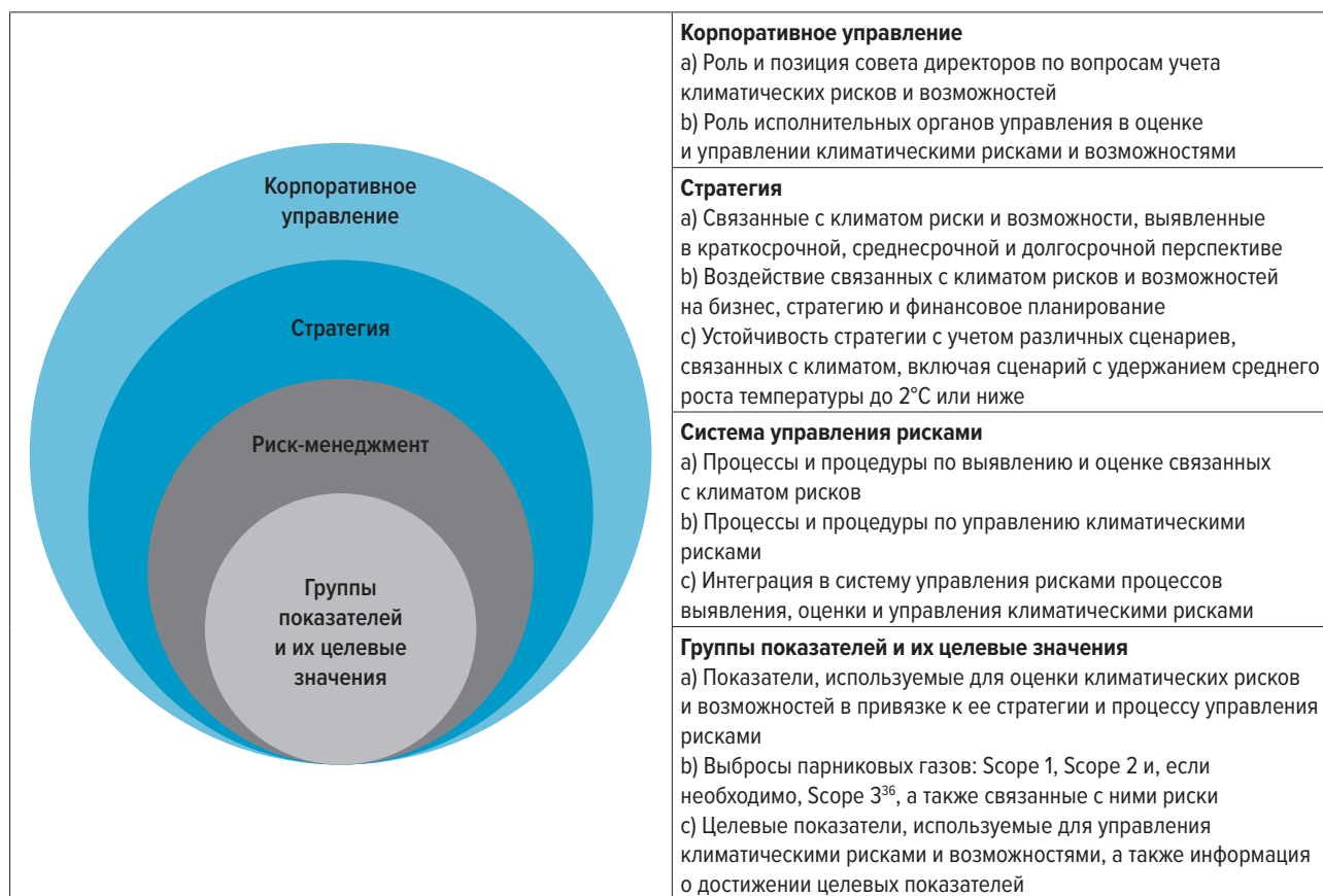
РИСУНОК 5. ОСНОВНЫЕ ИНФОРМАЦИОННЫЕ БЛОКИ, ПРЕДУСМОТРЕННЫЕ РЕКОМЕНДАЦИЯМИ ЦЕЛЕВОЙ ГРУППЫ ПРИ СОВЕТЕ ПО ФИНАНСОВОЙ СТАБИЛЬНОСТИ ПО РАСКРЫТИЮ ИНФОРМАЦИИ, СВЯЗАННОЙ С КЛИМАТОМ 35

Несмотря на то что Рекомендации Целевой группы при Совете по финансовой стабильности по раскрытию информации, связанной с климатом, предусматривают подходы к раскрытию климатической информации, основные информационные блоки, представленные на рисунке 5, рекомендуется использовать для раскрытия также и информации об иных факторах, связанных с окружающей средой и обществом (социальные факторы) в рамках существенных тем, определенных Обществом.